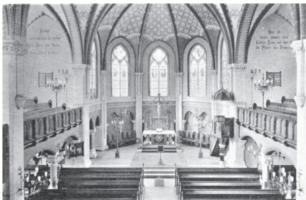
Blick in die St.-Markus-Kirche im Jahre 1907